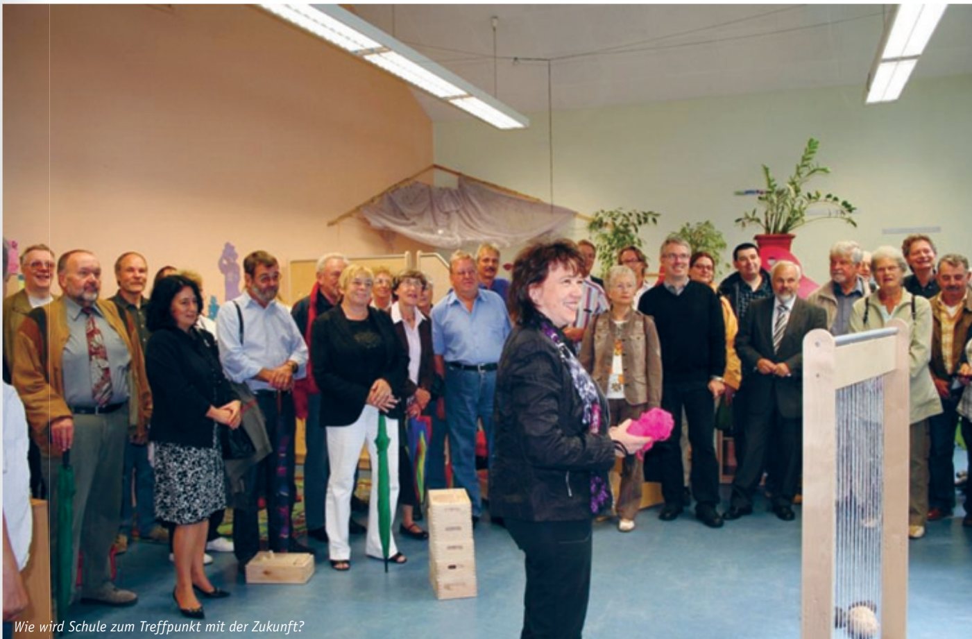
Wie wird Schule zum Treffpunkt mit der Zukunft?

ausgelegte Radwegenetze für Kinder ab der dritten Klasse machen auch Schulen im Nachbarort selbständig erreichbar. Dies kann Teil eines Bewegungsförderungskonzepts sein, in dem Voerde bis 2030 seine schulischen und landschaftlichen Potenziale verbindet.