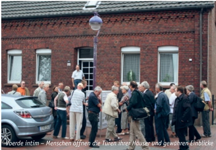
Voerde intim – Menschen öffnen die Türen ihrer Häuser und gewähren Einblicke

Interessierte teilnahmen. Zwei Rundschreiben haben seither über den Verlauf von VOERDE2030 informiert und die nächsten Schritte bekannt gemacht. Nächste Meilensteine sind weitere öffentliche Präsentationen und Diskussionen .