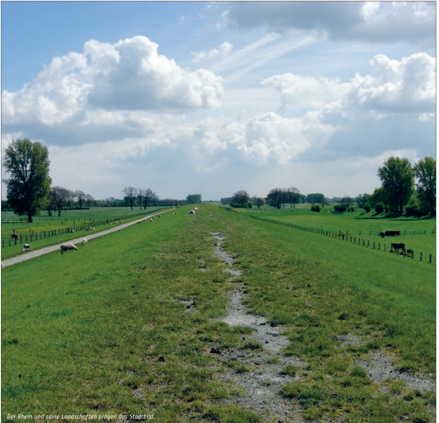
Der Rhein und seine Landschaften prägen das Stadtbild.