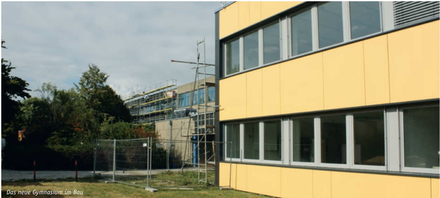
Das neue Gymnasium im Bau

CHANCEVOERDE: Schnittstellen zwischen Wirtschaft, Gesellschaft und Schule gestalten; Bildungslotse zur Orientierung im Chancen-Dschungel einsetzen; Neue Konzepte für Kinderbetreuung und Jugendförderung weiterentwickeln; Voerde als Schullandschaft denken; Wirtschaftsförderung breit diskutieren | DIALOGVOERDE: Netz für Engagement von Bürgerschaft und Wirtschaft aufbauen