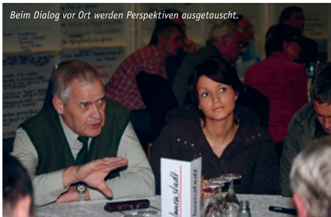
Beim Dialog vor Ort werden Perspektiven ausgetauscht.

Dialog zwischen Politik, Verwaltung und Bürgern gestalten: Die Verständigung über die Frage „Was ist unsere Stadt?“ wird bis 2030 ein wiederkehrendes Motiv in Diskussionen in Vereinen und Verwaltung sein. Die „Zugezogenen“ werden in diese Diskussion eingebunden. So können sich bürgerschaftliches Engagement und Stolz entfalten und Verbindungen zwischen Neubürgern und Alteingesessenen