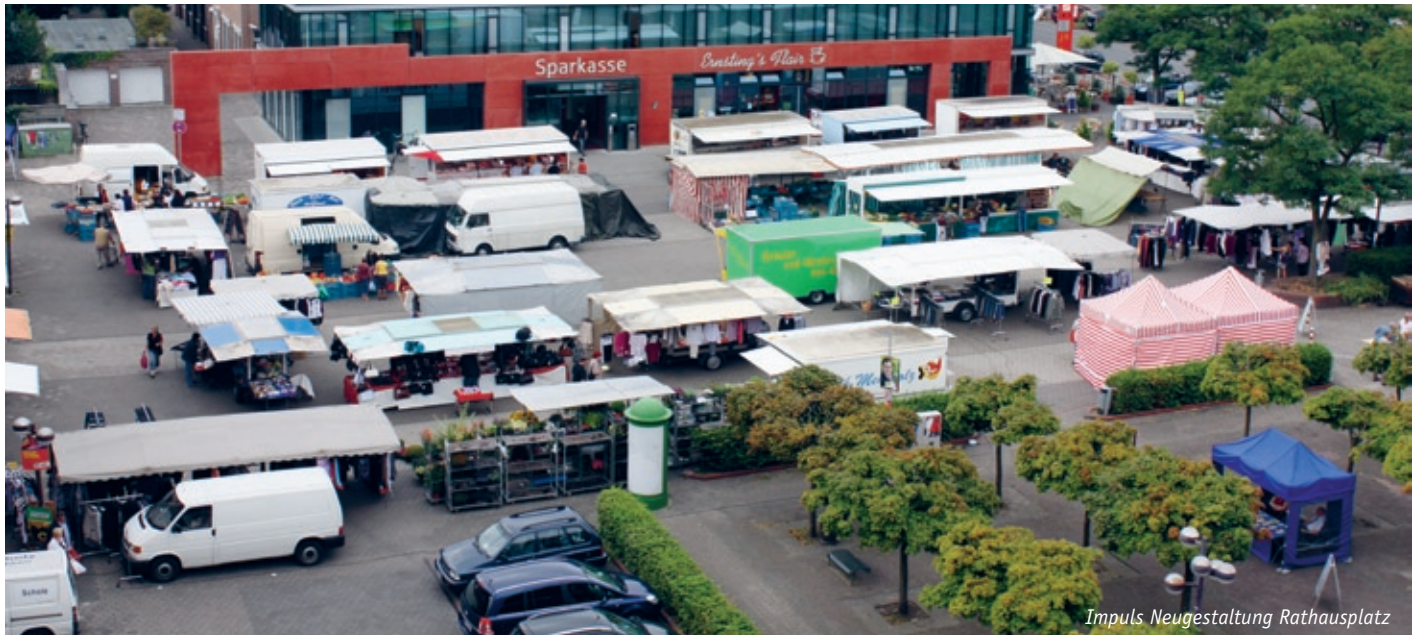
Impuls Neugestaltung Rathausplatz

HEIMATVOERDE: Vielfältige Nachbarschaften schaffen; Stadtquartiere als Minizentren und Sozialräume stärken | GESTALTVOERDE: Unverwechselbare, nachhaltige Ortsgestalten entwickeln; Stadtbild profilieren; Urbanes Zentrum Voerde umbauen und stärken