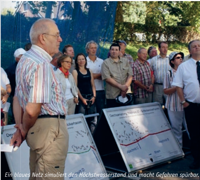
Ein blaues Netz simuliert den Höchstwasserstand und macht Gefahren spürbar.

Die Stadtspitze, die Vorsitzenden der Ausschüsse (Liegenschaften und Wirtschaftsförderung, Jugendhilfe, Kultur und Sport, Planung und Umwelt, Schule, Soziales, Betriebsausschuss) und aller Fraktionen sowie Vertreter relevanter Ämter haben die Zwischenergebnisse diskutiert und die Arbeit intensiv begleitet.