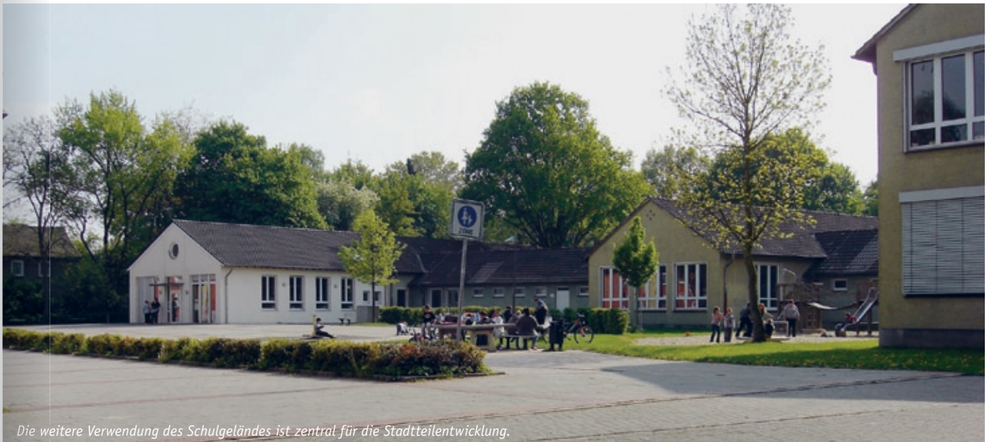
Die weitere Verwendung des Schulgeländes ist zentral für die Stadtteilentwicklung.