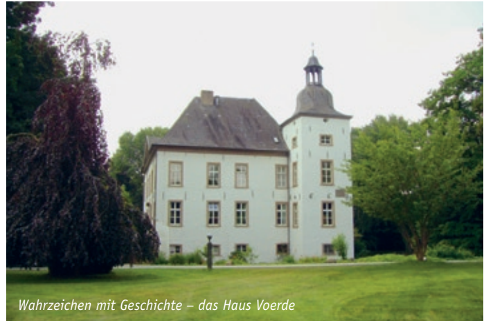
Wahrzeichen mit Geschichte – das Haus Voerde

Nachhaltige Mobilitätskonzepte entwickeln: Die zukünftigen Siedlungsentwicklungen müssen unabhängig vom motorisierten Individualverkehr funktionieren. In der dezentralen Siedlungsstruktur von Voerde ist die Qualifizierung der Fuß- und Radwegenetze zwischen den Ortsteilen eine zentrale Aufgabe bis 2030. Der Umgang mit dem motorisierten Verkehr muss die Balance zwischen Erreichbarkeit und Belastung schaffen.