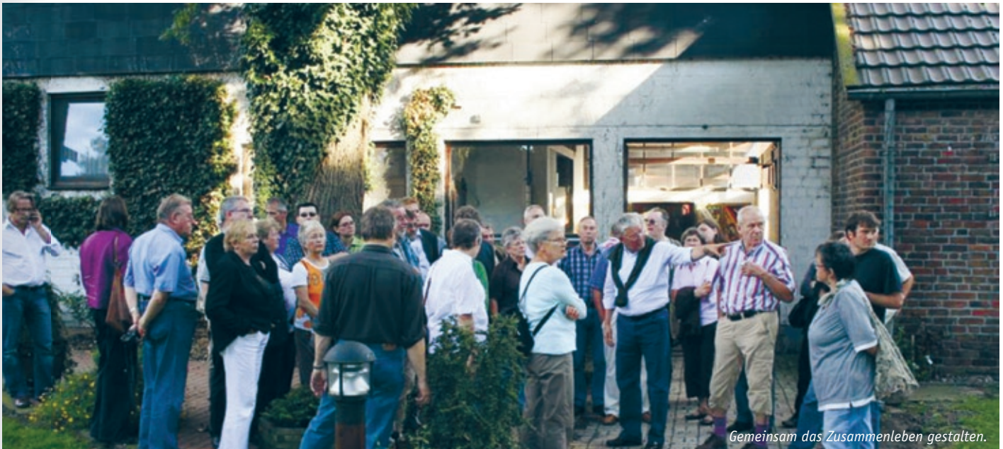
Gemeinsam das Zusammenleben gestalten.

CHANCEVOERDE: Schnittstellen zwischen Wirtschaft, Gesellschaft und Schule gestalten | ERLEBNISVOERDE: Menschen und Medien zu Botschaftern für Voerde machen | DIALOGVOERDE: Dialog zwischen Politik, Verwaltung und Bürgern gestalten; Netz für Engagement von Bürgerschaft und Wirtschaft aufbauen; Vereinsaktivitäten stärken und Vereine öffnen | HEIMATVOERDE: Stadtquartiere als Minizentren und Sozialräume stärken