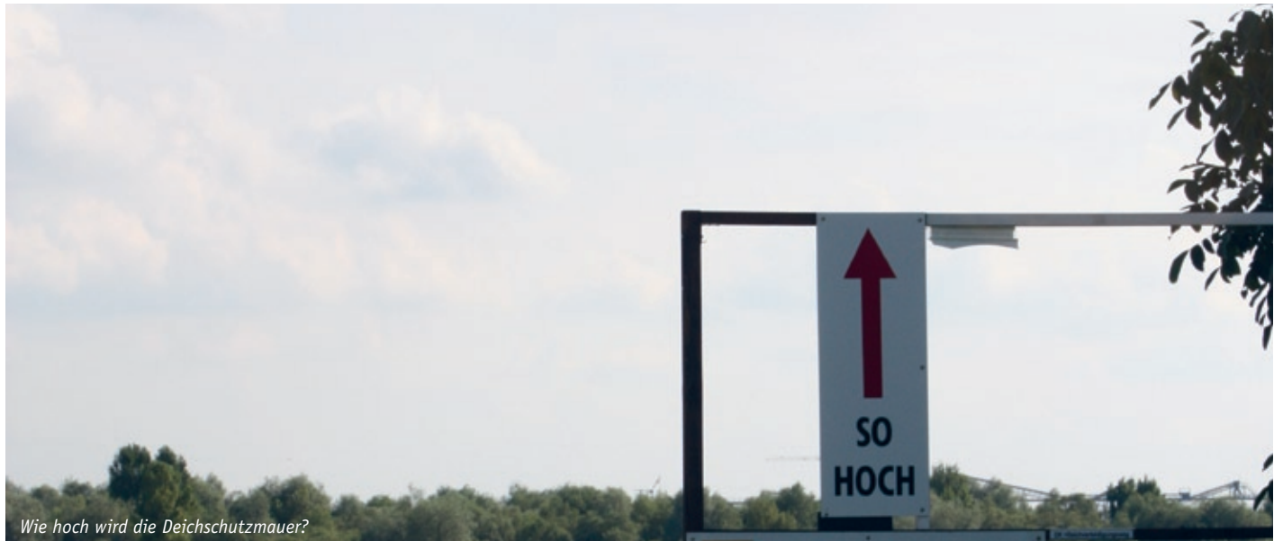
Wie hoch wird die Deichschutzmauer?