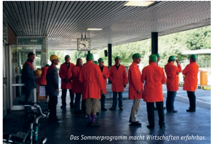
Das Sommerprogramm macht Wirtschaften erfahrbar.

Am 12. August 2008 ging es unter dem Stichwort „Wandel“ um Veränderungen im Schulalltag, in der Landwirtschaft, in Industrie- und Tourismuswirtschaft. Dazu standen Besichtigungen der Regenbogenschule in Möllen, des „Corus“-Aluminiumwerks, des landwirtschaftlichen Betriebs Bernds, des Reiterhofs Hinnemann und eine Schifffahrt zu den Auskiesungen am Rhein auf dem Programm. „Wohnen“ war am 22. August 2008 das Thema. Menschen aus Voerde haben dazu ihre Wohnungen geöffnet und so Einblick gewährt in ein Bahnarbeiterhaus, ein freistehendes Einfamilienhaus, ein Hochhaus in der Innenstadt, Siedlungen der 50er und 70er Jahre, aktuelle Neubausiedlungen und ein Altenheim. Die Exkursionsteilnehmer kamen ins Gespräch mit den Besitzern der Wohnungen und sprachen miteinander über ihre eigenen Vorstellungen vom Wohnen. Am 30. August 2008 drehte sich alles um „Wasser“. Es ging um Hochwasserschutz am Parkplatz „Arche“, wo der Hochwasserstand mit einem blauen Netz simuliert war. Eine Radtour durch die Mommniederung ermöglichte Einblicke in die Problematik der durch den Bergbau abgesenkten Bereiche und in das Entwässerungskonzept. Ein Besuch auf dem Rheindeich, am Hafen Emmelsum